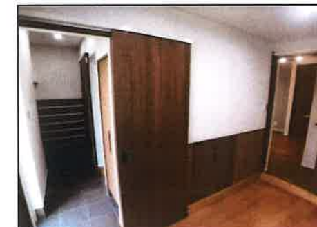
シューズクローク+多目的室